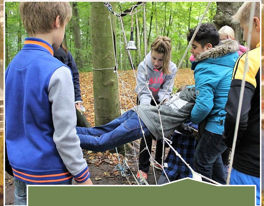
aktiv beim Sozialkompetenztraining