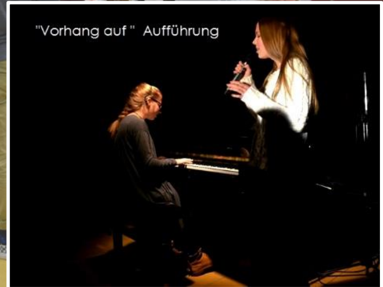
"Vorhang auf " Aufführung