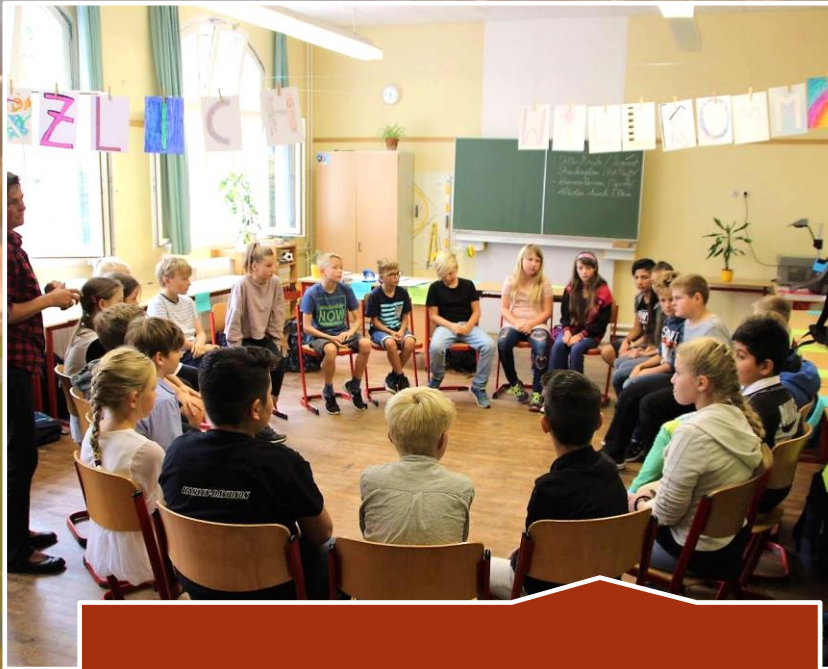
miteinander beim Klassenrat